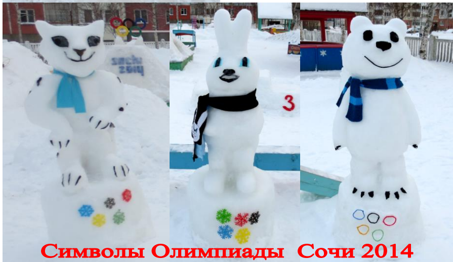
Символы Олимпиады Сочи 2014

И вновь снежные фигуры, сделанные усилиями педагогов и родителей воспитанников, порадовали ребят. В этом году на спортивной площадке детского сада появилась «олимпийская деревня», которая привлекла внимание местного телевидения. Репортаж был показан 05.01.2013 по каналу ТВС.